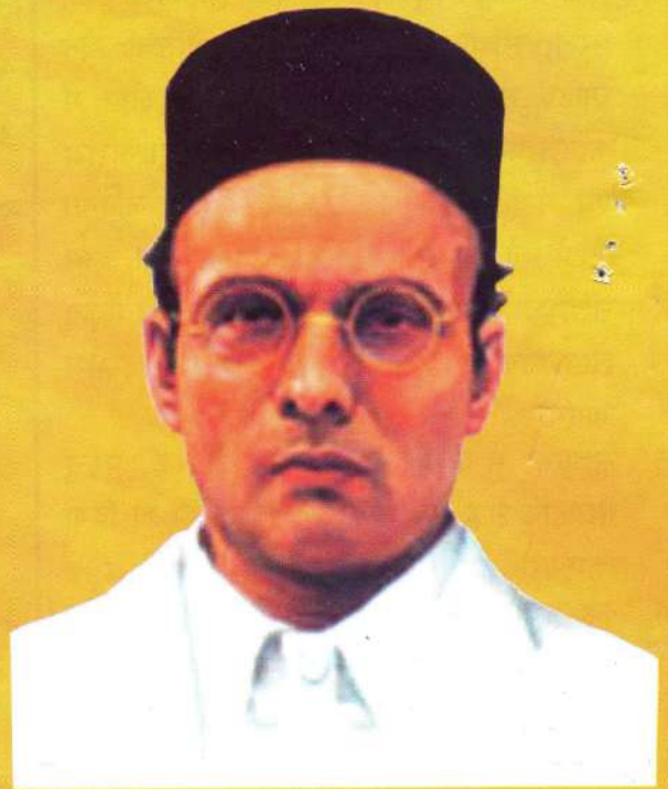
वीर विनायक दामोदर सावरकर