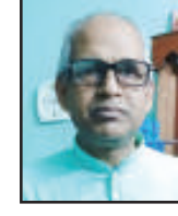
महाचार्यः मनतोषः भट्टाचार्यः वाली,हाओडा,पश्चिमवङ्गः॥ (कथासाहित्यप्रकरणे ममायं चतुर्दशतमः प्रयासः)