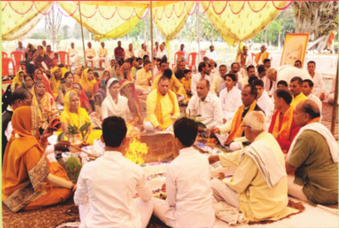
सामवेद परायण यज्ञ में आहुति देते यजमान