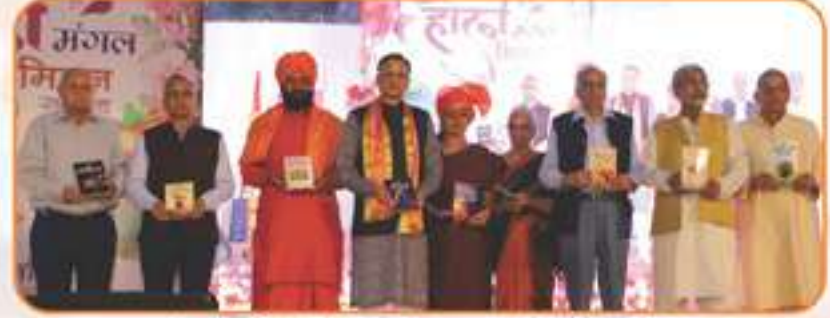
वर्तमान चुनौतियों से समाज को जागृत करने वाली पुस्तकों का विमोचन करते हुए आर्य समाज के अधिकारी