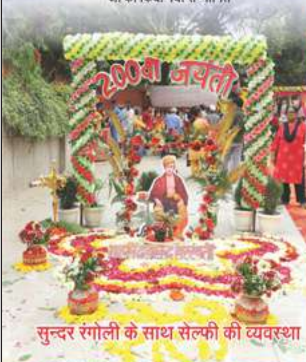
सुन्दर रंगोली के साथ सेल्फी की व्यवस्था