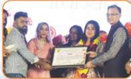
समारोह में नव दंपति को किया गया सम्मानित