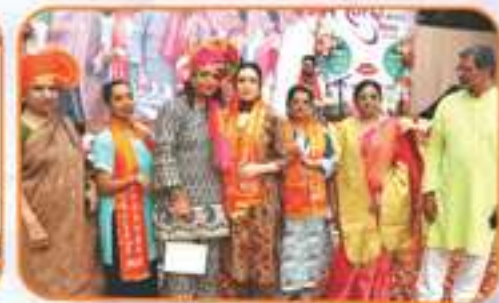
हॉलैंड से पधारी आर्य महिलाओं का किया गया अभिनंदन

होली मंगल मिलन समारोह में भव्य स्वागत द्वार पर एक दूसरे का तिलक लगाकर अभिनंदन करते हुए अधिकारी एवं आर्य परिवारों के होनहार बच्चे