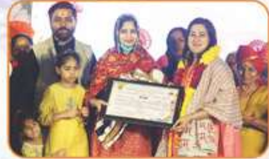
समारोह में सबसे छोटी आयु 6 दिन के नवजात शिशु का सम्मान