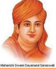
Maharishi Swami Dayanand Saraswati

AUM BHOOR BHURWAH SWAH, TAT SAVITUR VARENYAM BHARGO DEVASYA DHEEMAHI DHIYO YO NAH PRACHODAYAAT.